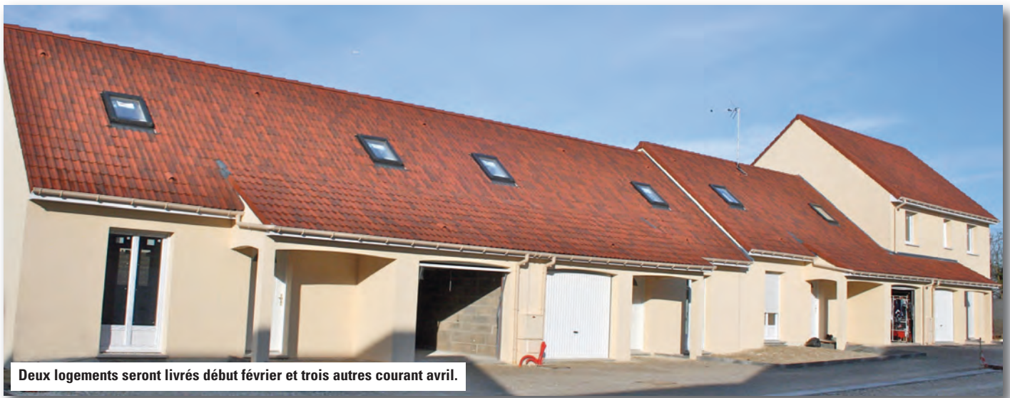
Deux logements seront livrés début février et trois autres courant avril.

Un nouveau lotissement est en construction à Mainvilliers : Chartres Habitat y proposera des pavillons en location.