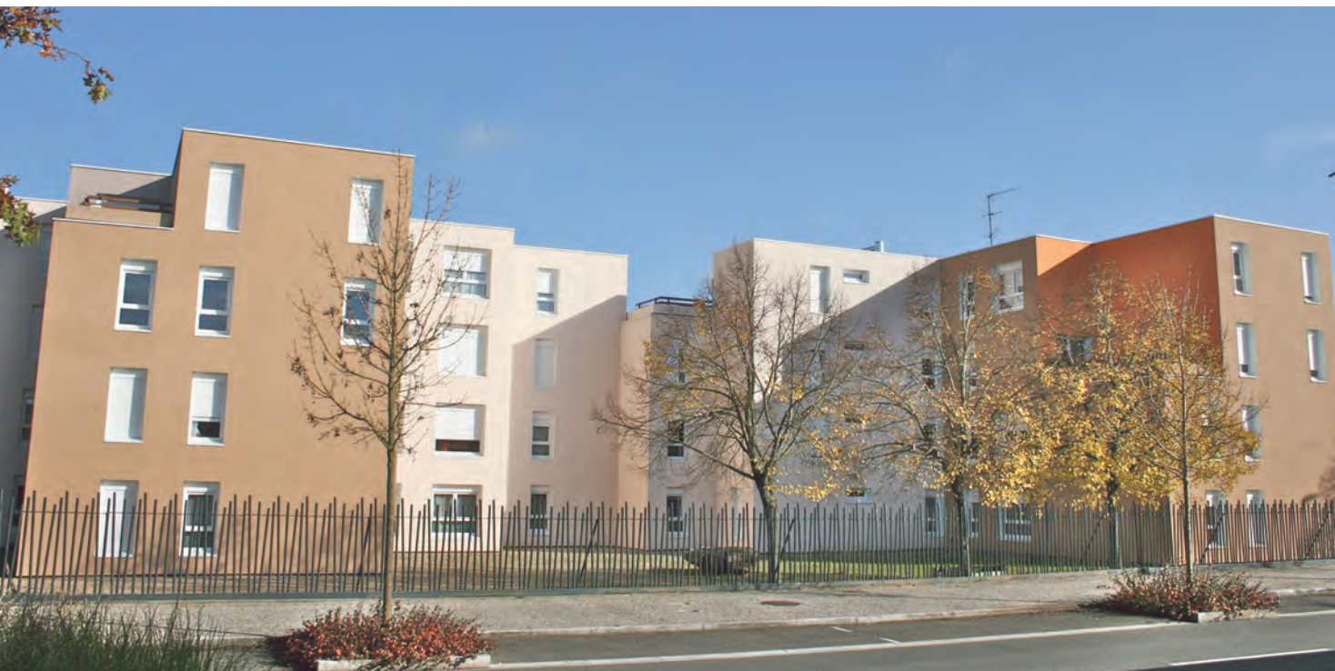
Rue Allende (ci-dessus), les immeubles sont par ailleurs en cours de résidentialisation avec la pose d'une clôture.