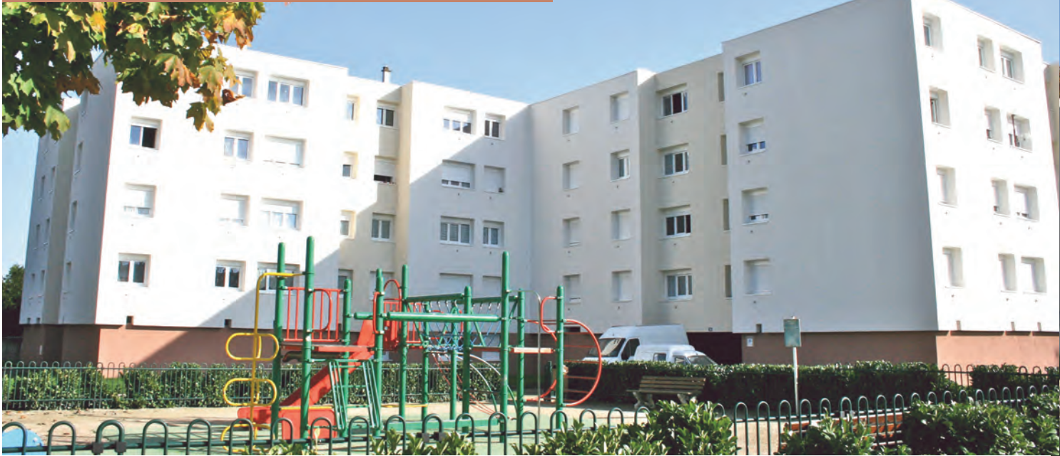
Les locataires des rues Allende et G.- P. Couvertes (ci-dessus) apprécient le nouveau confort apporté par les travaux d'isolation ainsi que le nouvel éclat des façades.