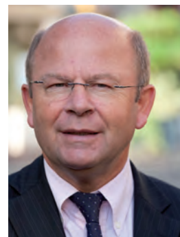
Jean-Pierre Gorges Président de Chartres Habitat Député-Maire de Chartres